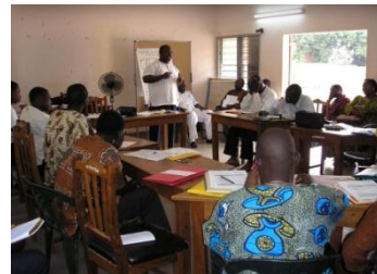
Appui à la gouvernance de l'eau