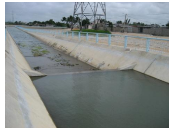
Collecteur à Cotonou