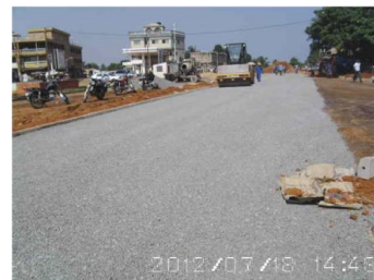
Aménagement de voirie, Togo