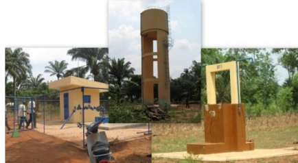
AEV en zone rurale au Bénin