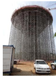
Château d'eau à Cotonou